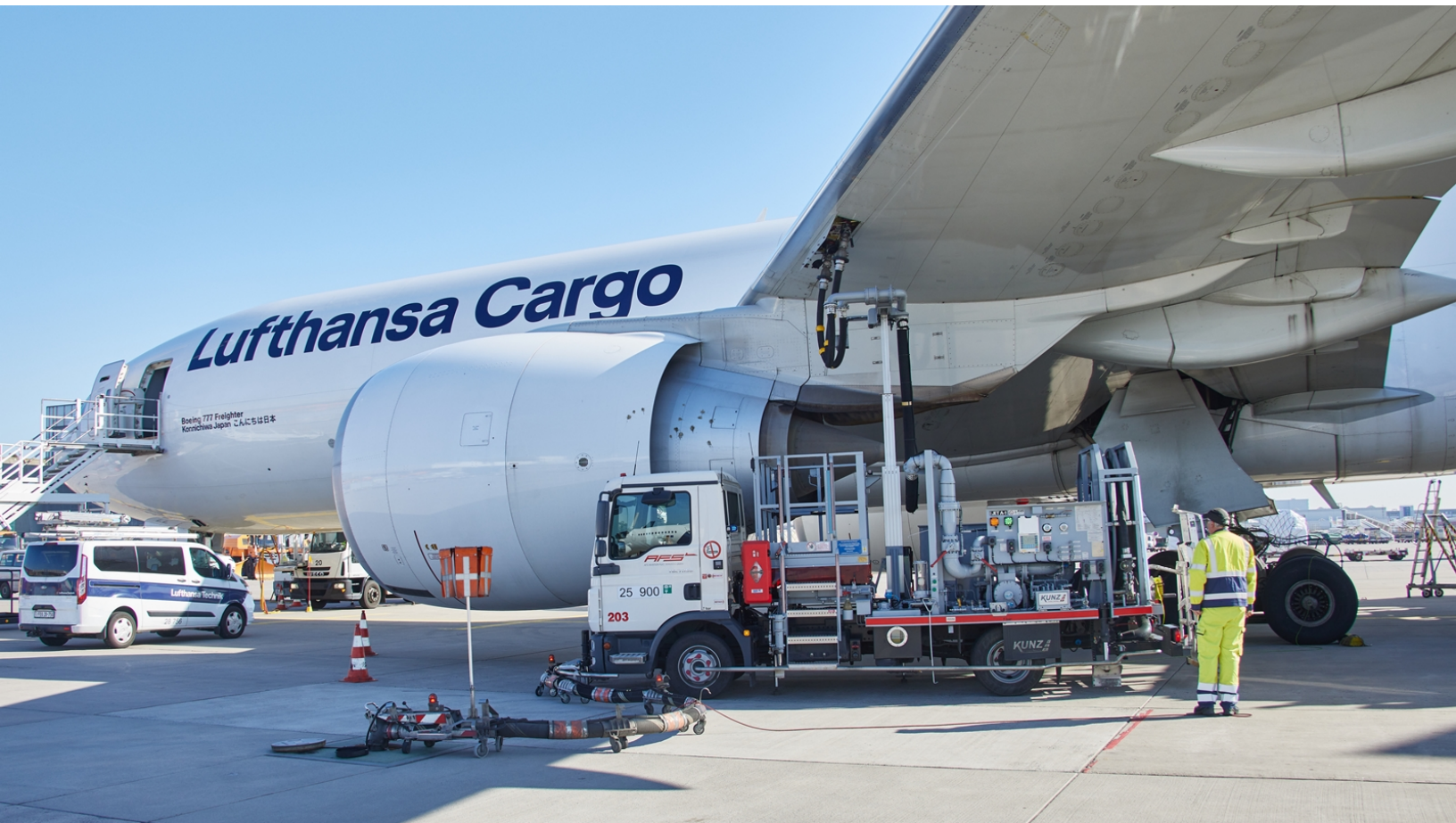
Betankung einer Frachtmaschine des Typs Boeing 777F