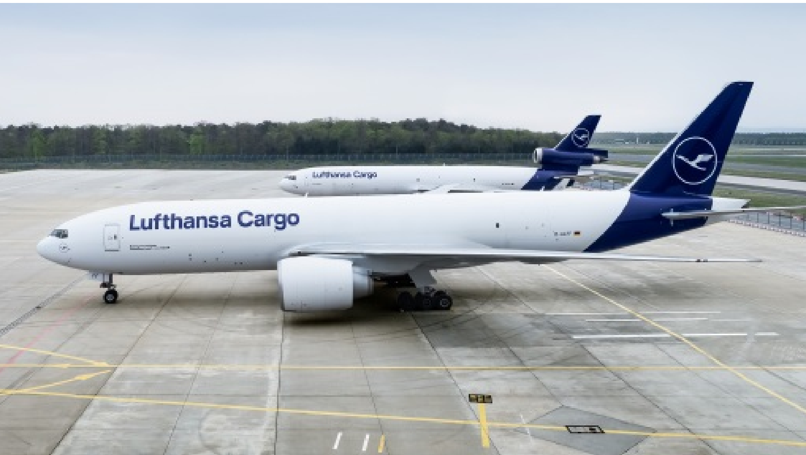
Lufthansa Cargo B777F vor MD-11F